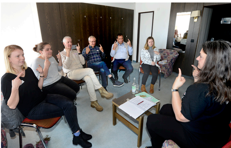
Geübt wird in kleinen Gruppen.

Derzeit betreut «a capella» um die vierzig Familien und über hundert Jugendliche und Erwachsene in der Westschweiz. Die Fachpersonen der Stiftung klären zusammen mit Lehrern, Schulinspektoren, Logopäden, Psychotherapeuten sowie Eltern ab, ob ELS für eine Person das Richtige ist und in welcher Dosis