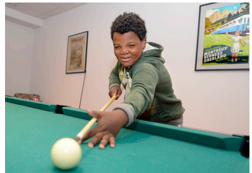
Zum Kinder-Rahmenprogramm gehört auch Billard.

Mit dem ELS-System lässt sich grundsätzlich jede Sprache und jedes Idiom kodieren. Doch die Ansprüche sind verschieden. Im Englischen und Französischen sind etwa dreissig und im Deutschen vierzig Prozent der Laute aufgrund des Lippenfilms sicht- und lesbar. Die restlichen werden verschluckt. Zurzeit gibt es 66 offizielle ELS-Versionen, von Kurdisch über Türkisch bis Chinesisch. Auch die Schweizer Dialekte lassen sich kodieren. Allerdings gibt es auch da Unterschiede. Die Phonologie des Berndeutschen mit seinen Doppelvokalen und Zwielaute macht den kodierenden Nichtbernern (bei der Aus-